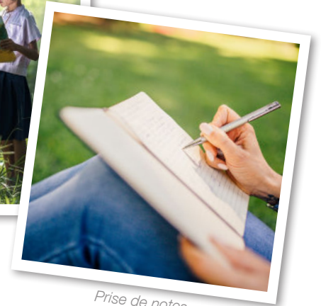
Prise de notes